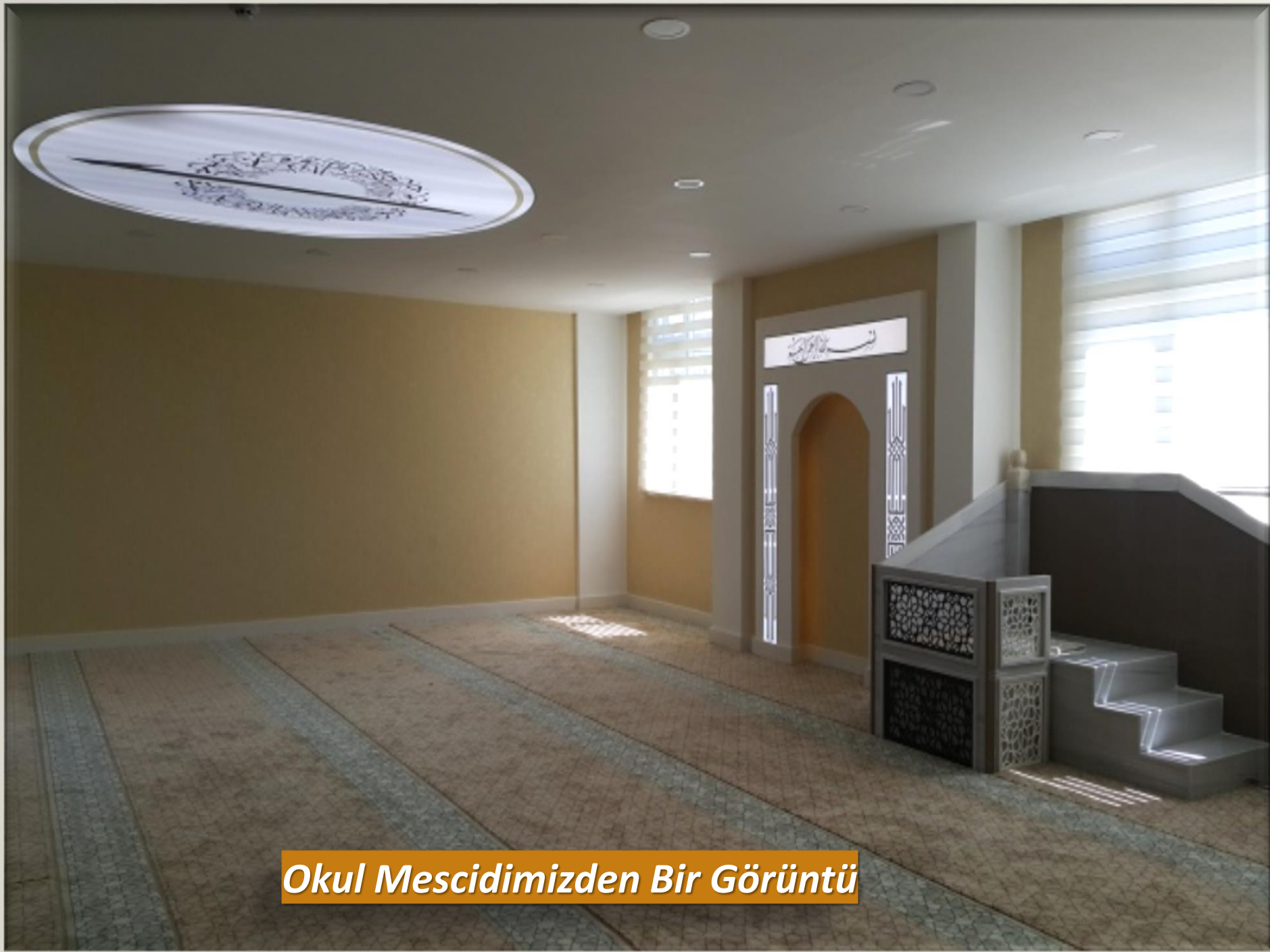
Okul Mescidimizden Bir Görüntü